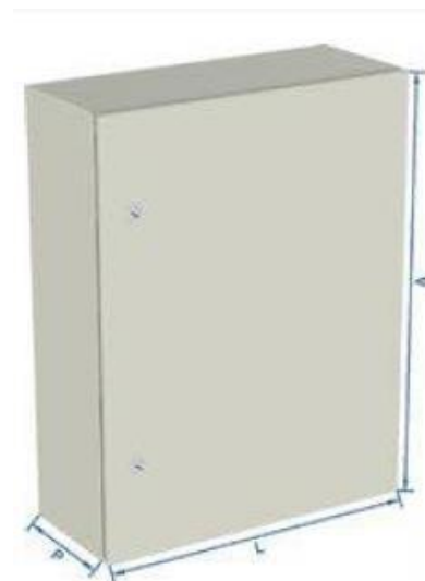
Painel tipo caixa de sobrepor